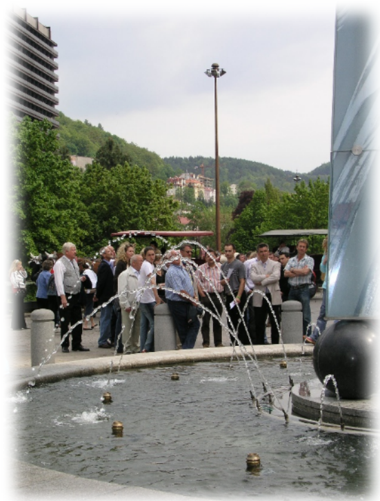
Eindrücke aus Karlsbad