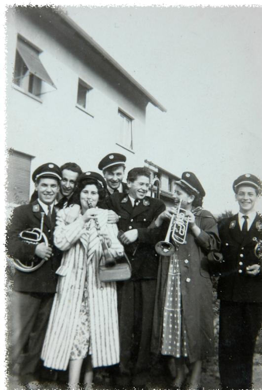
Musik machen ist doch schön...

Die Freundschaft wurde in den vergangenen 37 Jahren unentwegt gepflegt. Jährlich besuchen wir uns gegenseitig zu den Konzerten und Festen und es sind immer wieder besonders schöne Stunden, die wir miteinander erleben. Wenn wir mit dem Bus ins Elsass fahren, kommen wir selten zur geplanten Uhrzeit nach Hause.