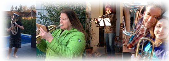
ein Teil unserer Musiker und Musikerinnen

Am 22.03.2020 gibt es eine bundesweite Aktion „EuropaHymne“ auf dem Balkon, auch wir beteiligen uns.