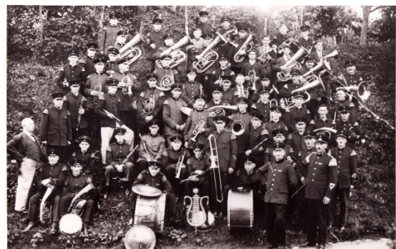
Gemeinsames Konzert Musikvereine Neuweier, Varnhald und Geroldsau Turnhalle Neuweier 1938

Im 3. Reich waren Uniformen der Wehrmacht und den NS-Organisationen vorbehalten. An den Fronleichnam-Prozessionen durfte die Kapelle nicht mehr in Uniform teilnehmen. Vermutlich sind es diese und weitere Gründe, warum die von den Bildern bekannte weiße Kleidung als