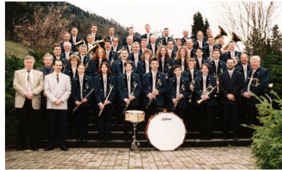
Die Musikkapelle im Jubiläumsjahr

Musikkapelle beim Festakt zum 100-jährigen Bestehen im Jahr 2000 vor.