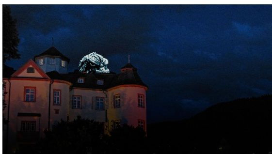
Godzilla schaut über das Schloß