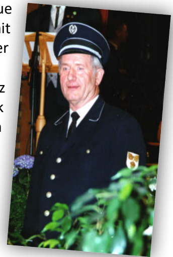
Diese Uniform zeigt Ihnen