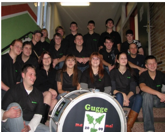
Die neu-formierte "Gugge-ma-mol-Mussi Neuweier"

neue Gruppierung aus dem Gesamtorchester heraus, zur "Gugge-ma-mol-Mussi Neuweier". Mit schrägen Tönen, lautem Schlagwerk und viel Begeisterung bereichern die närrischen Musikerinnen und Musiker die Fastnachtsszene in Neuweier, dem Baden-Badener Rebland und der weiteren Region.