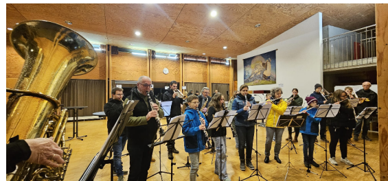
Gedenkgottesdienst in der St. Michaelskirche.

der St. Martinsfeier zusammen mit den Kindergarten- und Schulkindern beginnt es und findet ein Ende mit dem Weihnachts- und