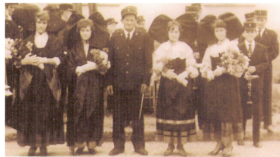
Das erste Treffen im Elsass