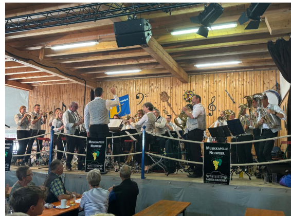
In der Fentes-Scheune

Zum zweitenmal nach 2018 kombinierten wir einen Vereinsausflug mit einem Auftritt im Allgäu. Das Walkartsfest in Waltenhofen im Allgäu war unser Ziel, wo die Fentes-Kapelle ihr