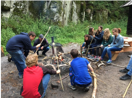
Unsere Jungmusiker im Steinbruch

Ansonsten war das Jahr 2017 geprägt durch allerlei Kameradschaftliche, als auch