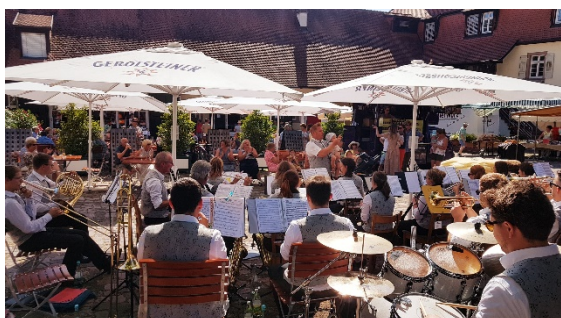
Naturparktag im Schloss Neuweier

Auch ein toller Event bei herrlichem Wetter im Schlosshof in Neuweier, der Naturparktag, der in Zusammenarbeit zwischen dem Weingut Schätzle und dem Naturpark Schwarzwald-Nord ausgerichtet wurde.